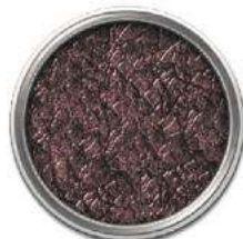
Черный +медная патина