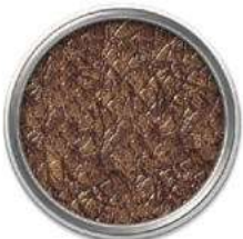
Коричневый +золотая патина