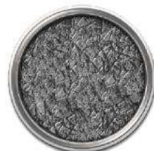
Черный +серебряная патина