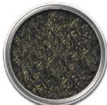
Черный +золотая патина